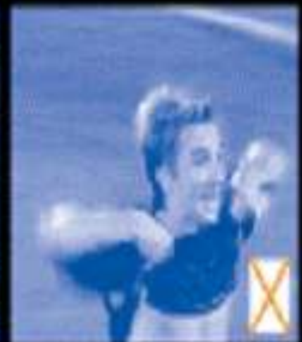
No Yellow Card